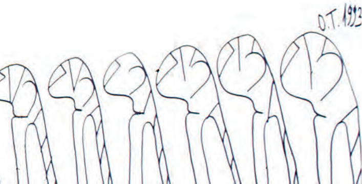
Oswald Tschirtner, Menschen (Detail), 1993

Geburtstagsfeier in der Villa inkl. Besuch des museum gugging . Kreativteil im „art labor“. Empfohlen für Kinder von 5 bis 11 Jahren. Dauer: 2,5 Stunden Preis: € 195.- für bis zu 10 Kindern , € 5.- für jedes weitere Kind bis maximal 15 Kinder